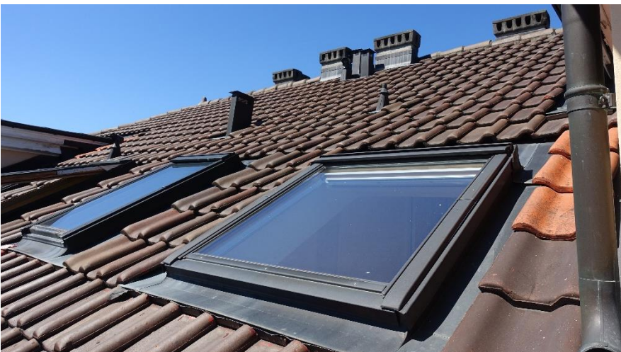
Toiture et velux