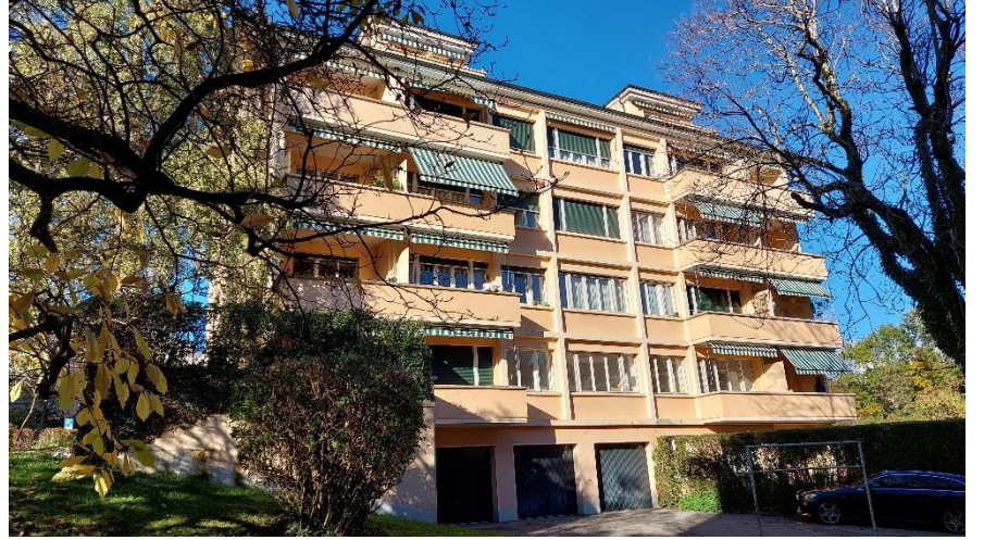
Façade sud et garages