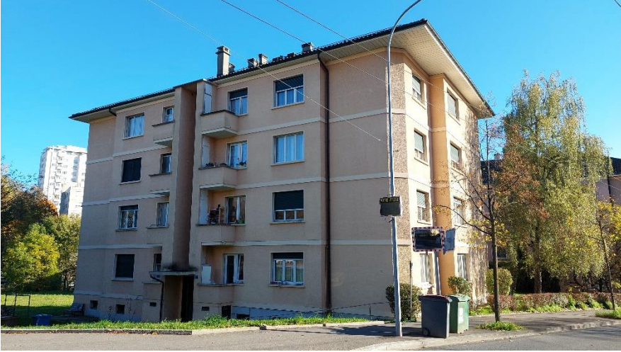
Façade nord et entrée