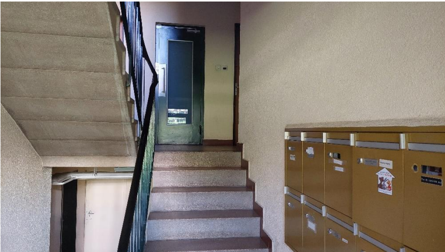
Cage d'escalier, ascenseur