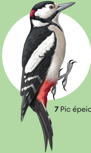
7 Pic épeiche