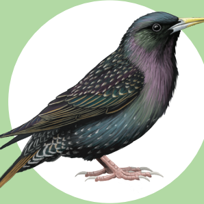
8 Etourneau sansonnet