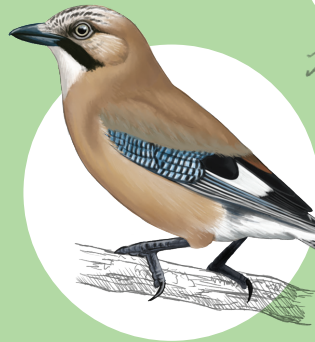
19 Geai des chênes