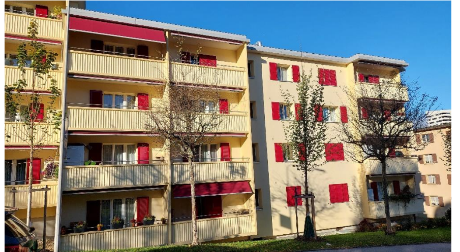
Façade sud (Cassinette 2)