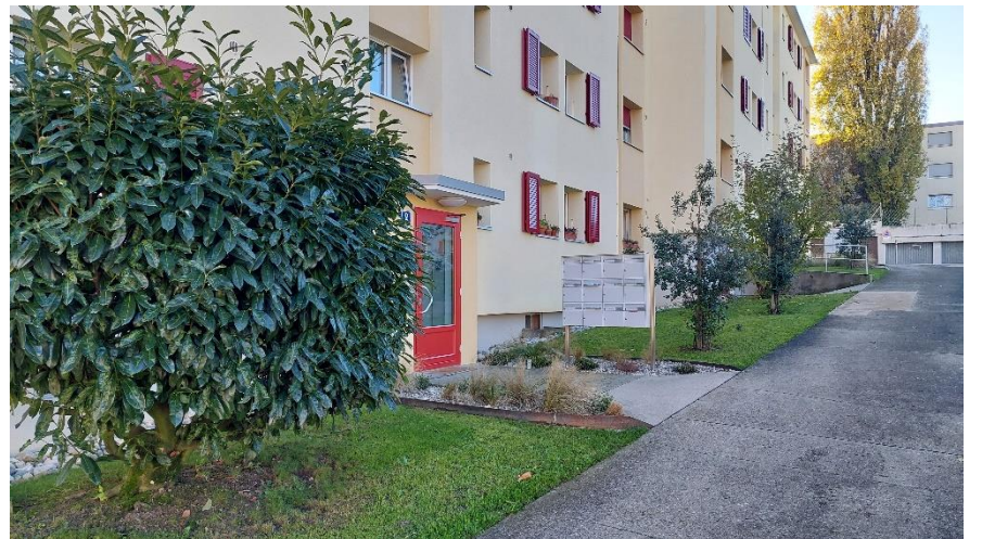
Entrée immeuble (Cassinette 2)