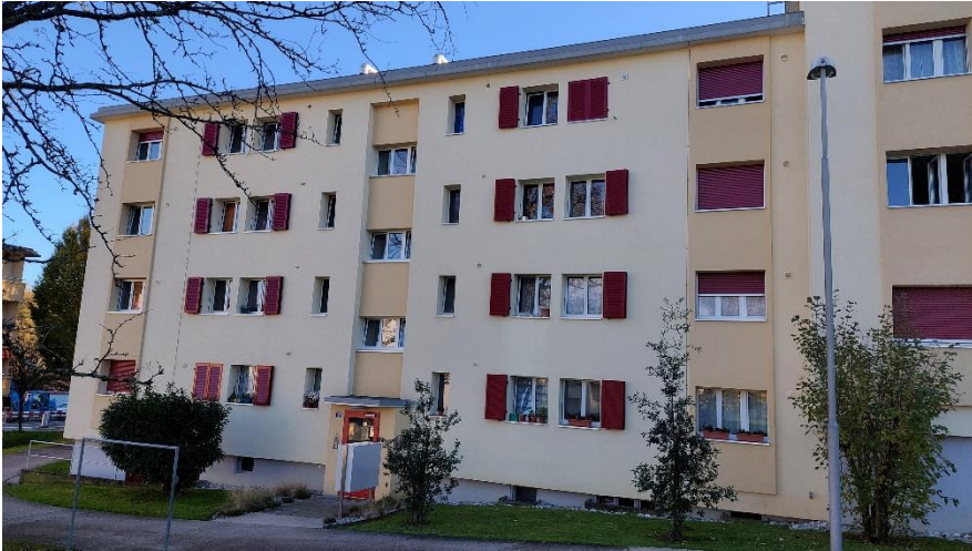
Façade nord et entrée (Cassinette 2)