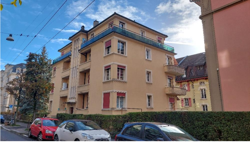
Façade nord et entrée