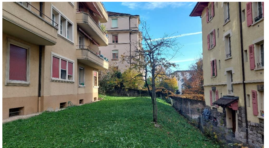
Espaces verts alentour