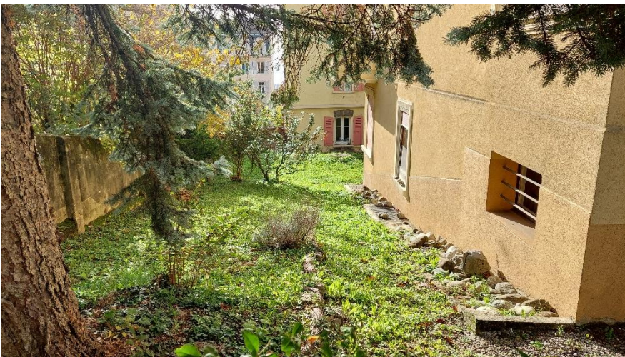
Espaces verts alentour