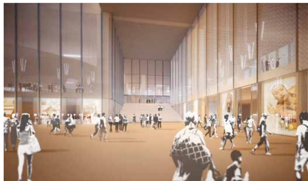
Un nouveau centre sportif à Malley