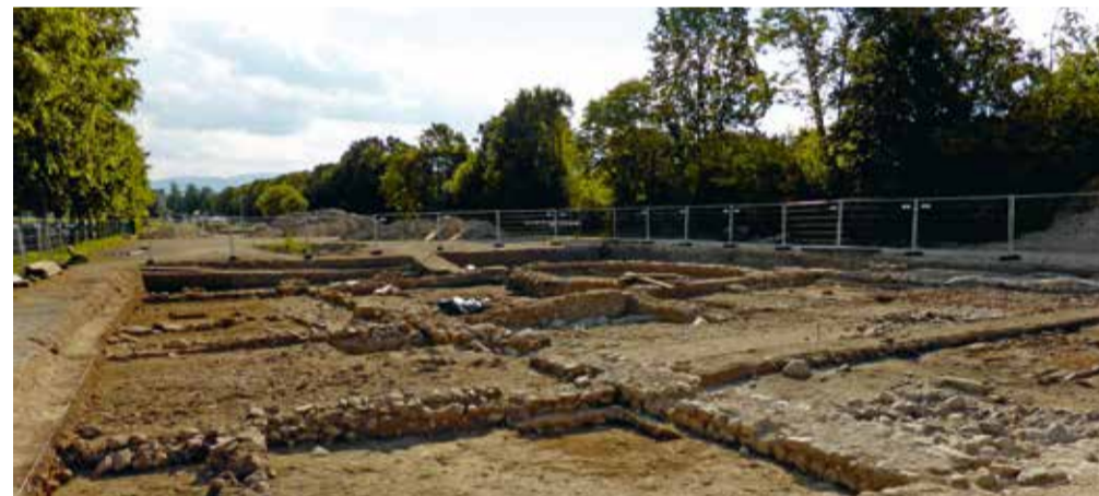
Fouilles archéologiques sur les Prés-de-Vidy