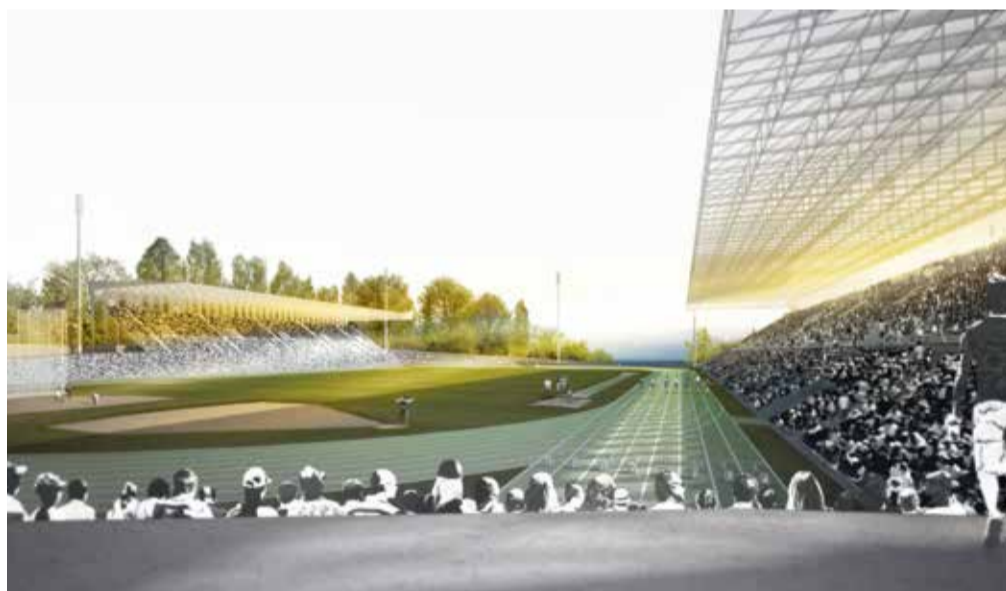
Vue de l'intérieur du stade de Coubertin