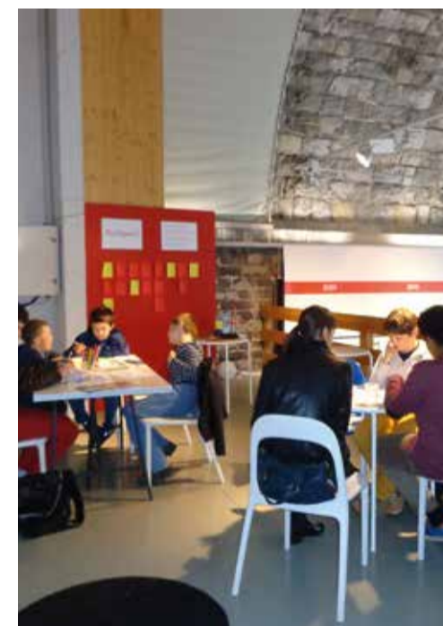
Ateliers participatifs sur les Plaines-du-Loup sous les Arches du Grand-Pont