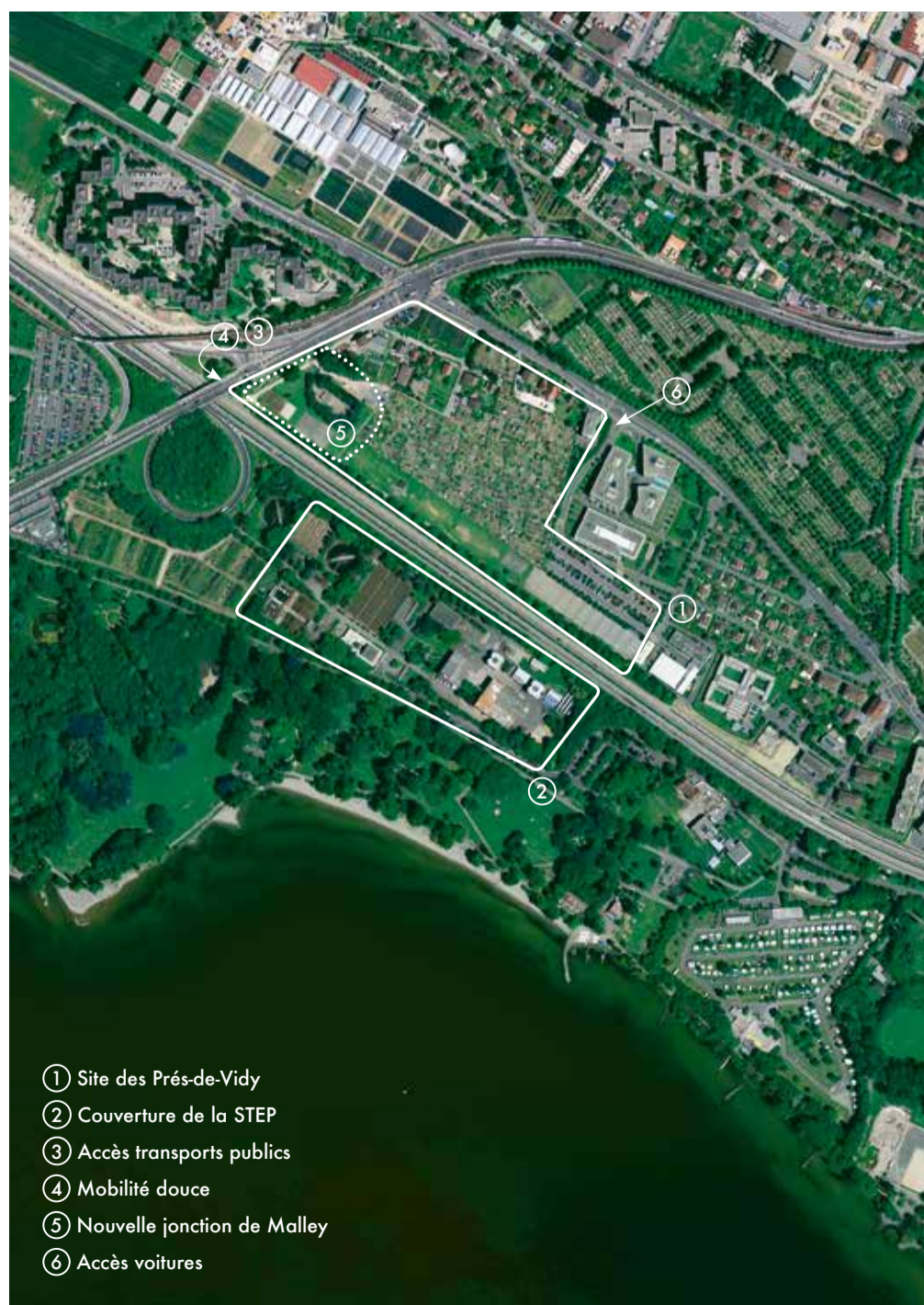
Vue aérienne des Prés-de-Vidy

La population et les groupes d'intérêt concernés seront à nouveau conviés pour la suite des réflexions. En 2015, ils participeront à l'élaboration des PPA 2 et 3.