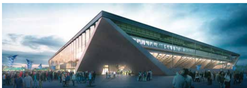
Vue extérieure sur le nouveau stade - accès sud et place publique

identitaires de la capitale olympique. Des infrastructures dédiées à la formation des jeunes talents, un restaurant, un espace pour séminaires, ainsi que le Service des sports de la Ville seront notamment installés entre ses murs. Profitant de l'arrivée du futur métro m3 qui desservira le site de la Tuilière, un nouveau centre d'affaires sera construit à l'ouest du stade de football.