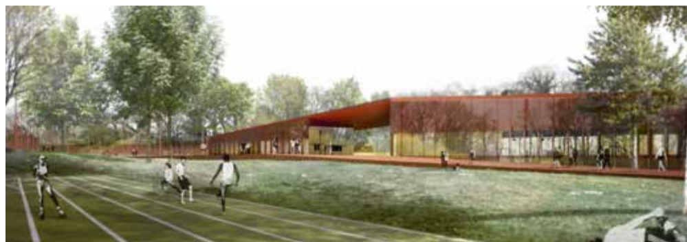
Image d'ambiance du futur centre de football

En novembre 2014, le public a pu découvrir le visage du nouveau stade de football. Développé par les bureaux d'architecture biennois :mlzd et Sollberger Bögli, la nouvelle enceinte permettra d'accueillir 12'000 spectateurs. Sa structure moderne « à l'anglaise » offrira aux supporters une proximité immédiate avec la pelouse. Grâce à une architecture novatrice et originale, le nouveau stade est amené à devenir l'un des bâtiments