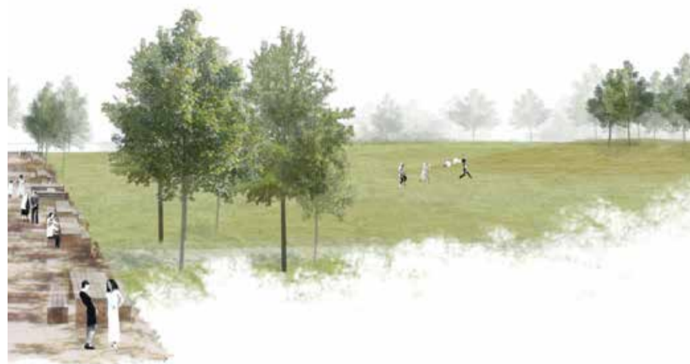
Vue sur le parc de l'écoquartier

Le plan directeur localisé (PDL) des Plaines-du-Loup fixe les grandes orientations et la vision à long terme de l'écoquartier. Approuvé en 2014, c'est sur sa base que la Ville a mené diverses démarches participatives afin d'intégrer aux réflexions l'ensemble des acteurs qui graviteront autour de ce futur morceau de ville. L'écoquartier des Plaines-du-Loup prévoit la construction d'environ 3'500 nouveaux logements pour accueillir, à terme, plus de 13'000 habitants et emplois. Des ac-