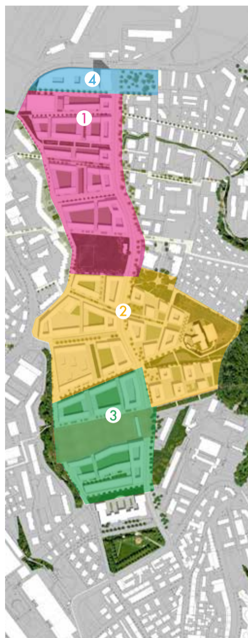
Périmètre des plans partiels d'affectation (PPA) sur le site des Plaines-du-Loup