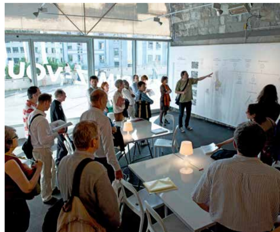
Visite guidée de l'exposition sur le Plan directeur localisé des Plaines-du-Loup.

L'implication de la population se décline différemment en fonction des nécessités et des étapes du projet. Elle comprend divers volets – information, consultation, négociation, concertation, co-construction – et emploie différents outils afin de créer une vision partagée parmi les acteurs. Les forums, tables rondes, expositions et réseaux sociaux sont des exemples d'outils concrets permettant de faire circuler les idées entre habitants, professionnels et politiques.