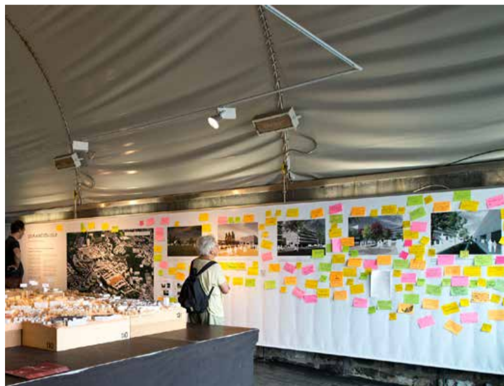
Les 143 post-it expriment les préoccupations et les questions des visiteurs de l'exposition présentée lors de la consultation publique du Plan directeur localisé des Plaines-du-Loup, du 6 mai au 19 juin 2013.