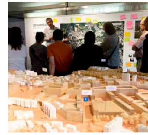
Présentations de la maquette de l'écoquartier des Plaines-du-Loup.