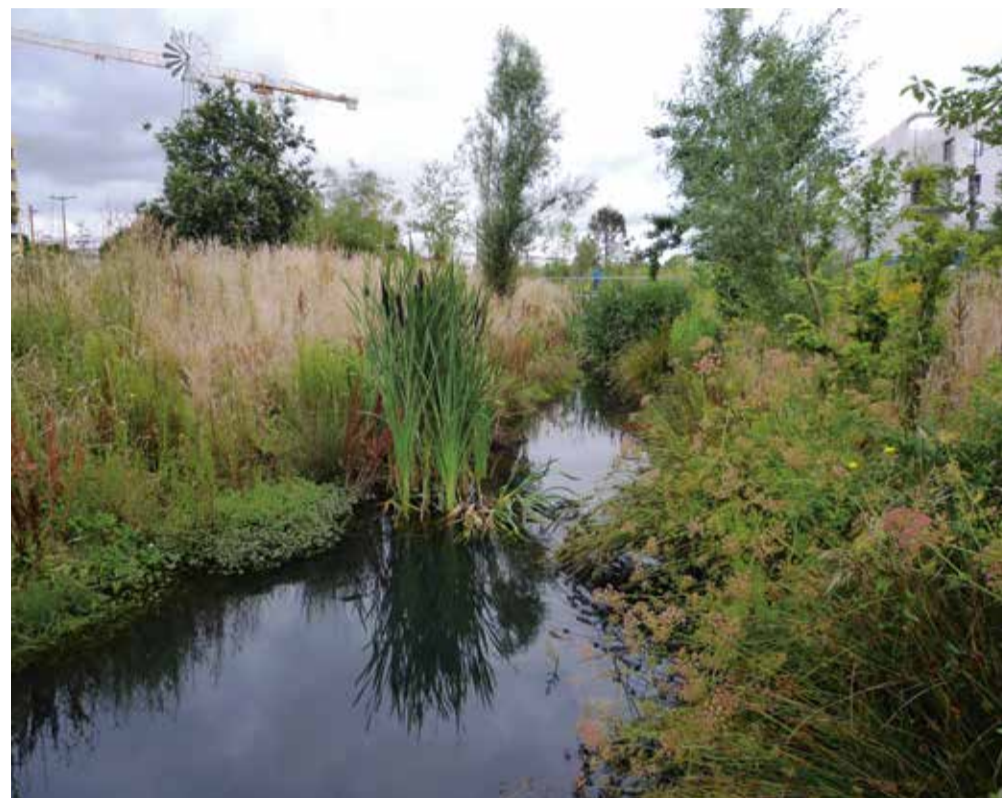
Ci-dessous : Légende