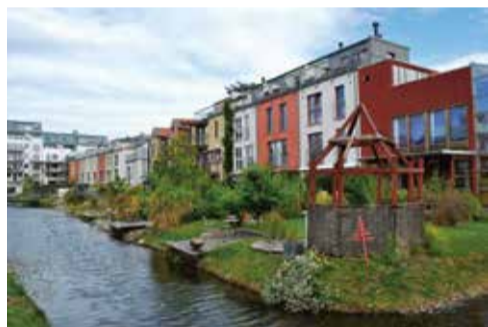
Ci-dessous : Légende