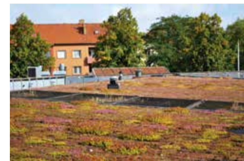
A gauche : Légende