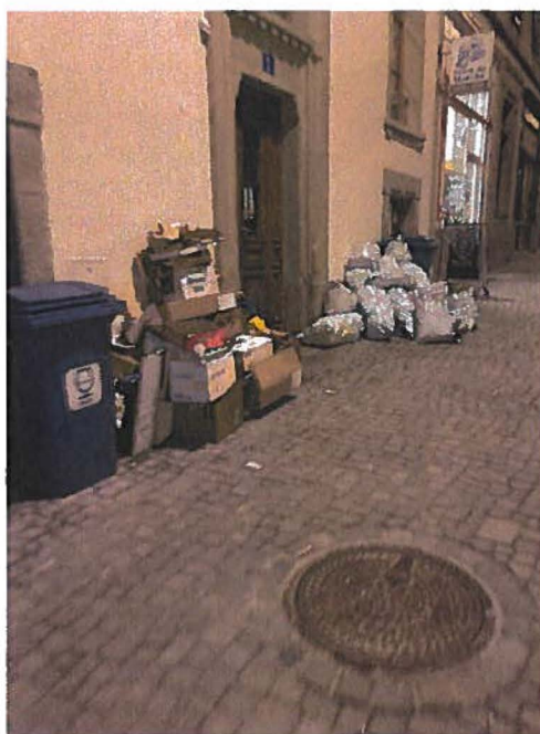
Photos prises à la Place de la palud et à la Rue pré-du-marché les 17 et 18 janvier 2022