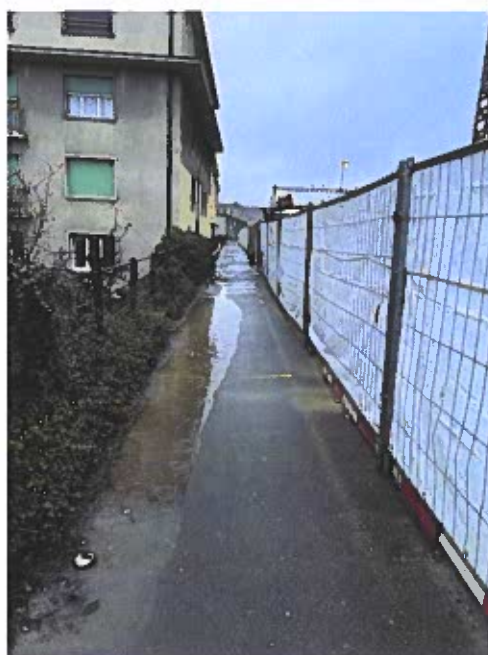
Fig. 1 – Quai de Jurigoz en temps de pluie

Les travaux de la gare, bien que nécessaires pour l'évolution de notre ville, ont réduit significativement la largeur du passage sur le quai Jurigoz, créant des désagréments majeurs pour les piétons mais également pour les cyclistes. Les jours de pluie, l'eau s'accumule sur les chaussées, rendant le parcours non seulement inconfortable mais également dangereux. De plus, les barrières de chantier actuelles obstruent le passage et ne facilitent pas la circulation, particulièrement pour les personnes à mobilité réduite.