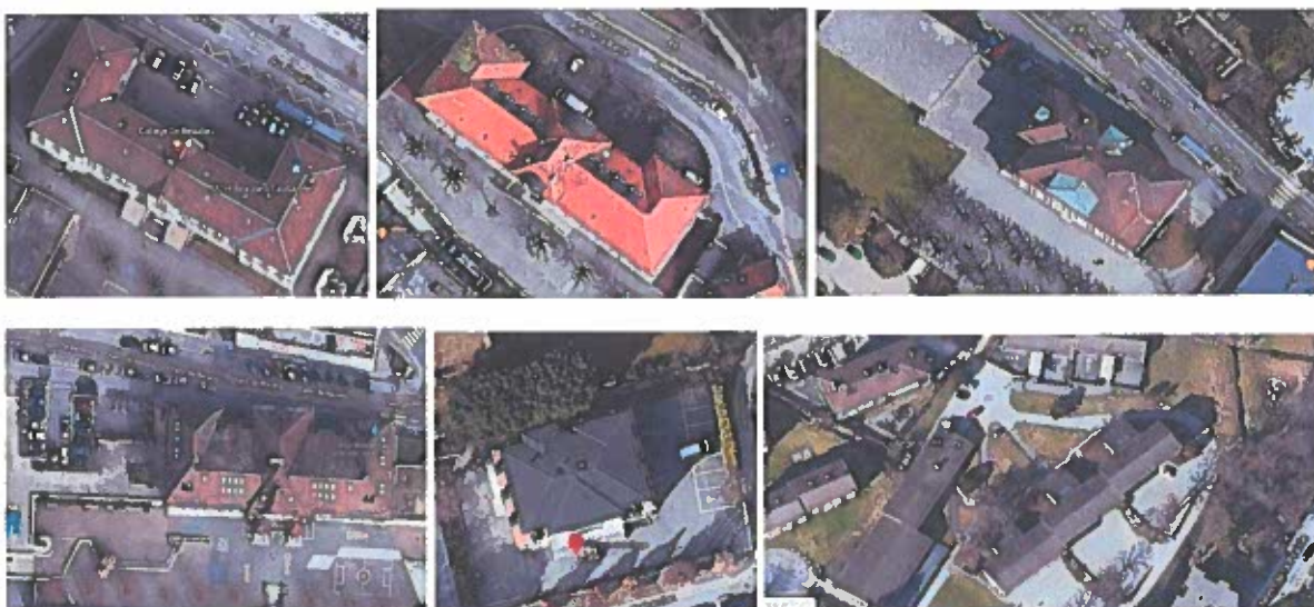
Figure 1: De gauche à droite, du haut au bas : Collèges de Beaulieu, de la Barre, Druey, de Prélaz, de Florimont et de Malley

De nombreuses places de parking pour véhicules motorisés privés se trouvent à l'intérieur de l'espace réservé de plusieurs écoles lausannoises. Souvent, l'emplacement de ces places de parc force les véhicules à traverser l'espace prévu pour accéder à pied à l'entrée des bâtiments scolaires. Des exemples sont visibles dans les images ci-dessous :