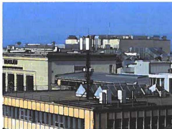
Photos de 2021 depuis la Violette et du 13 août 2023 depuis le « Café Perché » (VB)